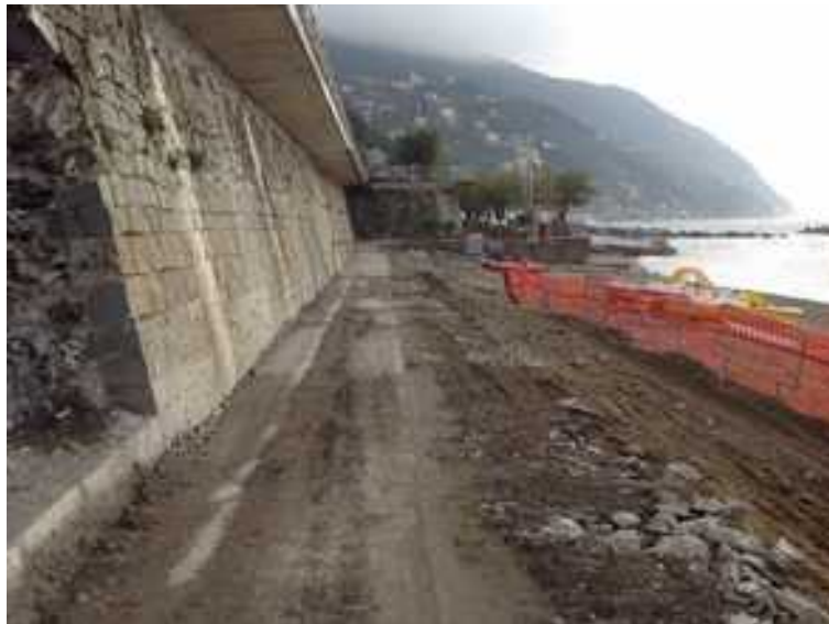
Figura 4 – Vista ex terrapieno ferroviario lato mare, porzione a Levante del Municipio