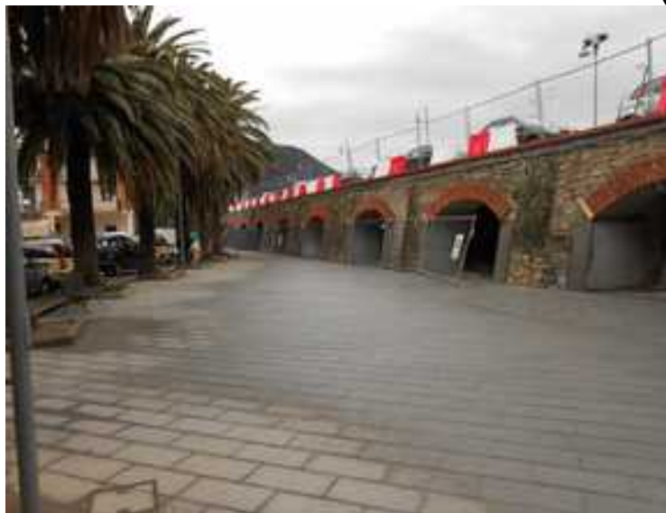
Figura 1 – Vista porzione lato levante Municipio