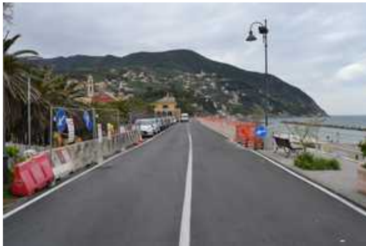
Figura 5 – Vista complessiva tratto stradale Lungomare Dante Alighieri (zona interessata ai lavori P.C. 21/2012)