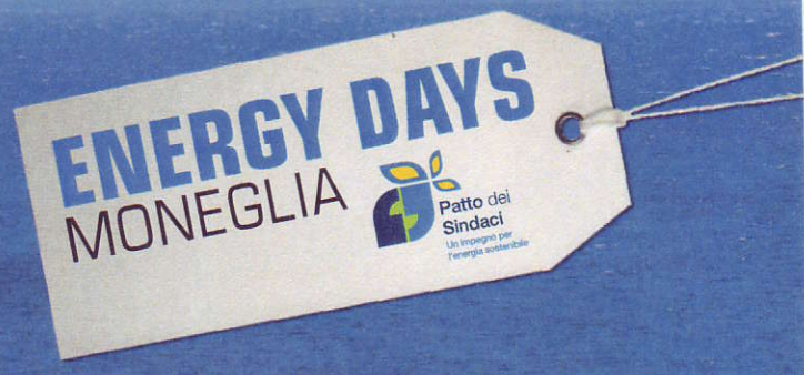
TAVOLA ROTONDA "DA MONEGLIA A KYOTO, VIA COPENHAGEN" Giovedì 24 febbraio 2011, ore 10.00 Sala del consiglio comunale di Moneglia | Corso Libero Longhi, 25

IL CLIMA CAMBIA. QUANTO, DIPENDE ANCHE DA NOI DI MONEGLIA. www.laprovinciaperilclima.it